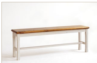
FH302040 Bank B/H/T ca. 153/52/35 cm