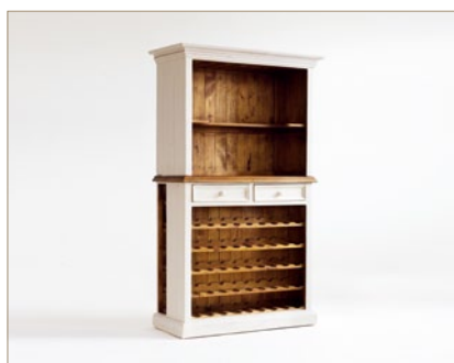
FH302014 Buffet mit Weineinsatz 2 Schubkästen / 2 offene Fächer B/H/T ca. 112/190/52 cm