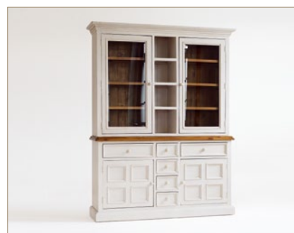
FH302013 Buffet 4-trg. / 6 Schubkästen / 4 offene Fächer B/H/T ca. 166/215/45 cm