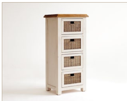
FH302030 Kommode mit 4 Rattankörben B/H/T ca. 58/127/45 cm