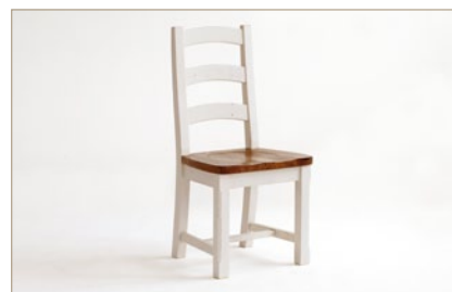
FH302045 Stuhl, ungepolstert Höhe ca. 108 cm / Sitzhöhe 49 cm