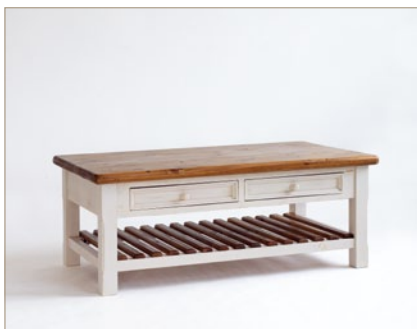
FH302055 Couchtisch 2 Schubkästen / 1 Ablagefach B/H/T ca. 140/55/80 cm (Beine ca. 10x10 cm)