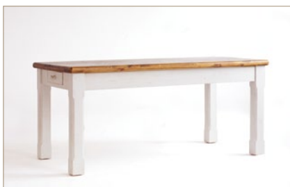
FH302050 Tisch mit 2 Schubladen B/H/T ca. 180/80/90 cm