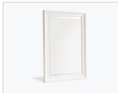
FH302020 Spiegel B/H/T ca. 106/150/9 cm