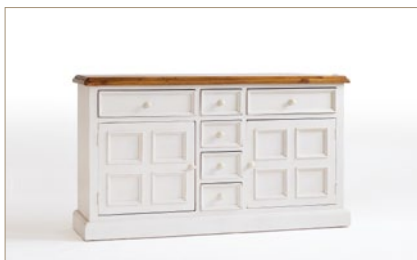
FH302003 Sideboard 2-trg. / 6 SK B/H/T ca. 160/91/45 cm

Durch diese unterschiedlichen natur- sowie verwendungsbedingten Merkmale der Hölzer entsteht die einzigartige Oberfläche, die jedes Möbel aus dem Programm „BODDE“ zu einem unverwechselbaren Unikat macht.