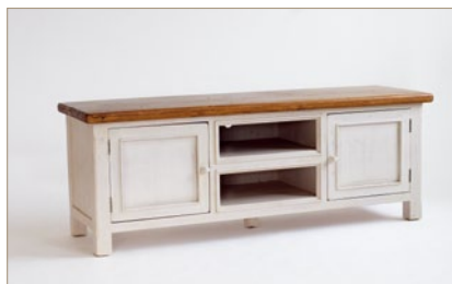
FH302060 TV-Element 2-trg. / 2 offene Fächer B/H/T ca. 178/65/54 cm